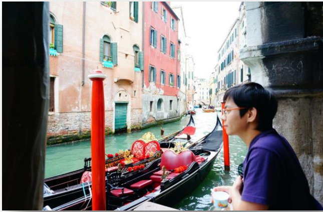
威尼斯運河畔喝咖啡