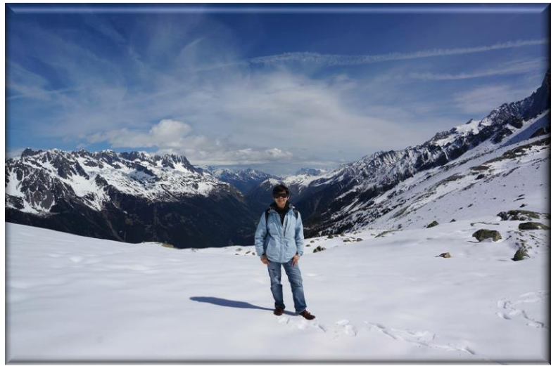
眺望西歐第一高峰「白朗峰」